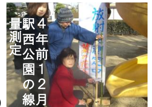
4年前の12月、駅西公園の線量測定

議論しました。私（日本共産党）は、「2年半近く審査してきた請願であること。議会はまもなく改選を迎えること。請願を受理した議会議員としてきちんと判断をくだし採決すべき。請願の趣旨をふまえ、福島の実状を見れば、なおさら委員会採決を行い、12月議会本会議に報告すべき」と、採決することを主張しました。