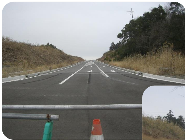
駆上線（勝木田団地側）から撮影