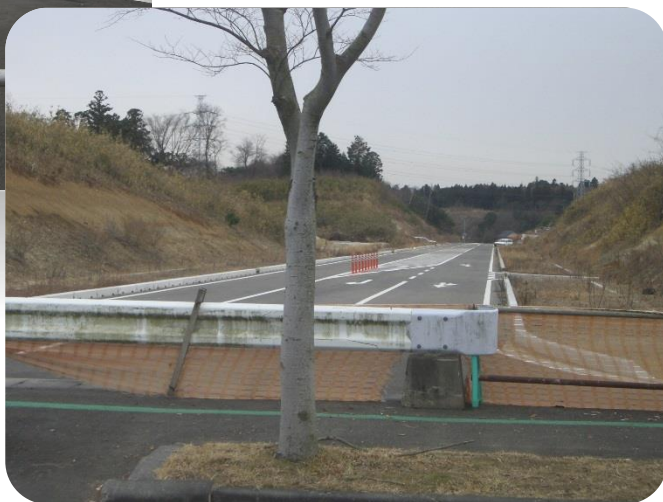
東海駅東大通り（東海病院側）から撮影

動燃・駆上線の中丸地区から東海駅東大通りの東海病院北側をつなぐ計画道路が完成していますが、「どうしても通れないの？」という住民からの疑問が寄せられました。